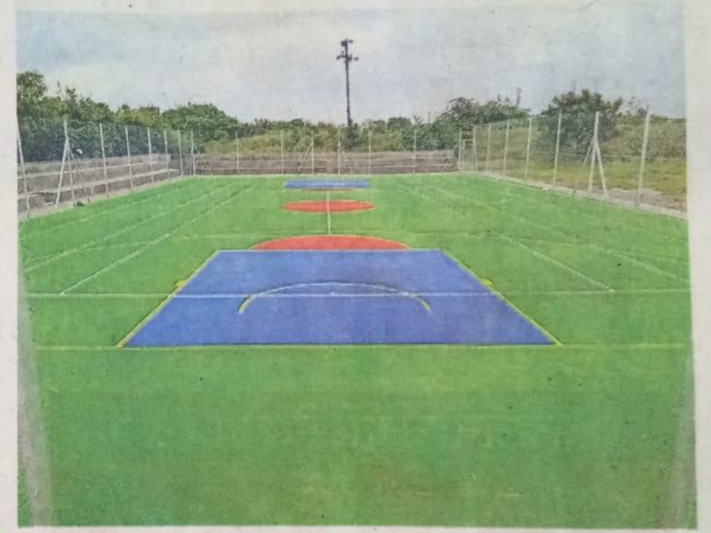
कुंभारी येथील अश्विनी वैद्यकीय महाविद्यालयातील लॉन टेनिस कोर्ट.

'लॉन टेनिस व बास्केटबॉलचे हे सिंथेटिक कोर्ट एकाच ठिकाणी तयार करण्यात आले असून, या कोर्टसाठी सुमारे २५ लाख रुपयांचा खर्च झाला आहे. त्याचे काम मुंबईचे महमद रिझवान यांनी केले आहे. सप्टेंबर अथवा ऑक्टोबरमध्ये याचे उद्घाटन करण्यात येणार आहे. टेनिसचे नेट पोल व बास्केट पोल पोर्टेबल आहेत. त्यामुळे दोन्ही खेळासाठी हे कोर्ट वापरता येणार आहे, असे हे सोलापुरातील पहिलेच कोर्ट आहे. महाविद्यालयातील विद्यार्थ्यांसाठी वेळ राखीव ठेवून अन्य वेळेत अक्कलकोट व दक्षिण सोलापूर तालुक्यातील उदयोन्मुख खेळाडूंनाही या कोर्टचा लाभ घेता येणार आहे.